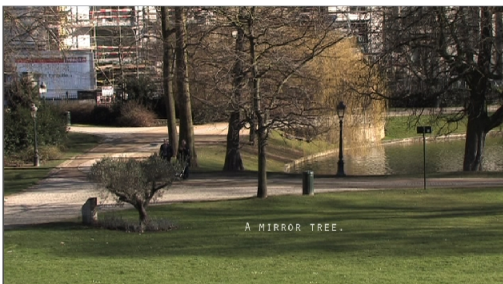
עץ מראה - מתוך הסרט