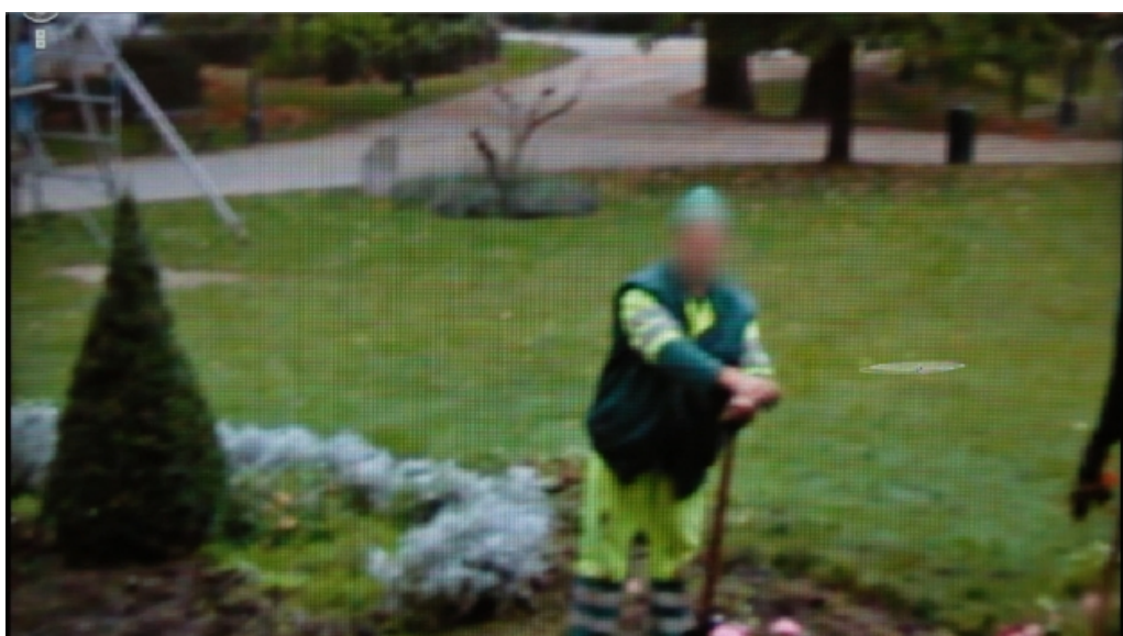
כולם עדים, כולם חשודים - מתוך הסרט