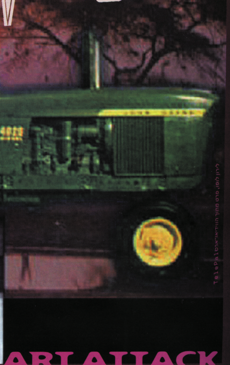
לינה ספיר, סרט מותחן, לוסט (Telap)